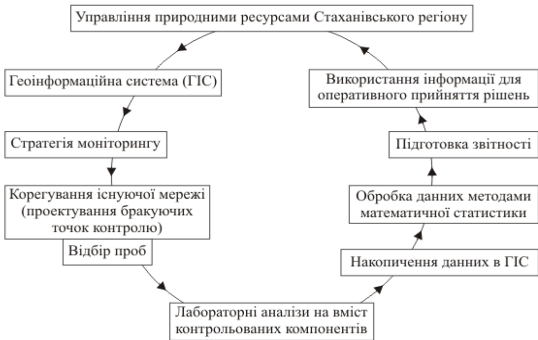
Рис. 3. Цикл моніторингу оточуючого природного середовища (на прикладі Стаханівського регіону Луганської області)

Таким чином, умовно кожний цикл моніторингу є реальною можливістю аналізу інформаційних потоків і надання оперативних рекомендацій для коректування як реалізованих заходів, так і завдань наступного циклу.